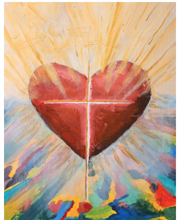
Acryl von Lyn Harms

Heute wählt die ÖAB (Ökumenische Arbeitsgesellschaft für Bibellesen) die Jahreslosung aus. Jedes Mitglied schlägt aus der Bibellese für das betroffene Jahr ein Bibelwort für die Jahreslosung vor. Nach ausführlichem Diskutieren und Beraten wird aus 2 bis 3 Vorschlägen gewählt. Die aktuelle und politische Lage spielt hierbei keine Rolle, da die Auswahl stets 4 Jahre im Voraus getroffen wird. Wichtig ist, dass eine zentrale Aussage der Bibel in den Blick kommt.