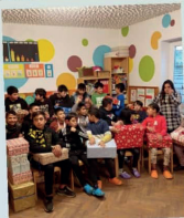
Die Kinder in Siebenbürgen und die IG Rumänienhilfe bedanken sich bei den Spendern der Weihnachtspakete