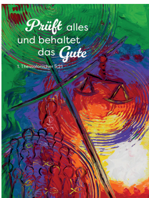
Acrylmalerei von Doris Hopf